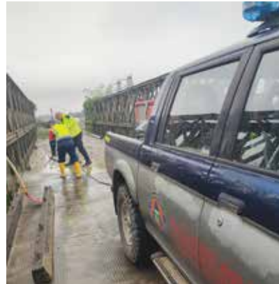
Grazie ai preziosissimi volontari di Pro Natura Bologna e della Seconda Colonna Mobile della Protezione Civile del Friuli Venezia Giulia per tutto l'impegno in aiuto alla popolazione in questi giorni così difficili. Il loro intervento con mezzi avanzati è stato determinante fin dalle prime ore dell'emergenza per la risoluzione degli allagamenti in diverse zone di Zola Predosa. Grazie anche a tutti i volontari singoli che si sono prestati in aiuto alla protezione civile o che hanno offerto il loro tempo per supportare le famiglie che hanno subito allagamenti.

In riferimento agli eventi alluvionali del 19 e 20 ottobre scorsi, invece, affiancati dall'aiuto incessante sin dalle prime ore dell'emergenza dall'Associazione di volontari di Protezione Civile Pro Natura , e poi dalla colonna mobile della Protezione Civile del Friuli mandataci a supporto del coordinamento regionale, abbiamo eseguito direttamente o in somma urgenza, ovvero con affidamenti diretti e immediati ad aziende specializzate, così come la normativa consente in casi emergenziali, interventi di ripristino stradale, pulizia e/o a supporto della popolazione per circa 25.500 euro a cui abbiamo aggiunto altri 50.000 euro circa per i lavori di ricostruzione della spalla del ponte sul Lavino in corrispondenza di via Don Fornasari realizzati in tempi strettissimi riuscendo così anche a togliere dall'isolamento una famiglia rimasta al di là del torrente senza strada di collegamento al resto della viabilità (e con l'idea, in prospettiva, di utilizzare questo ponte come "passerella" per l'attraversamento del Lavino all'interno del Percorso Vita).